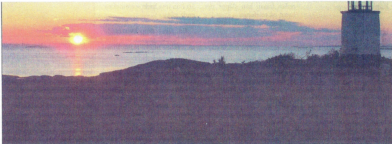
Solnedgång sedd från Högens utsiktsplats på Nordkoster.

Författaren arbetar med miljö- och energifrågor inom privat och offentlig sektor.