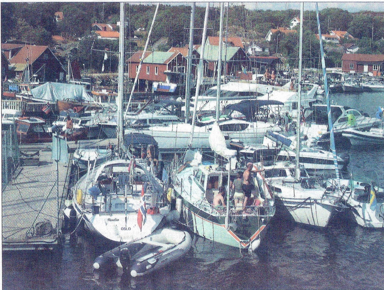
Hamnen vid Västra Bryggan Nordkoster – mötesplats för båtar; en del av "det rörliga friluftslivet", där Sverige är unikt genom sin allemansrätt.