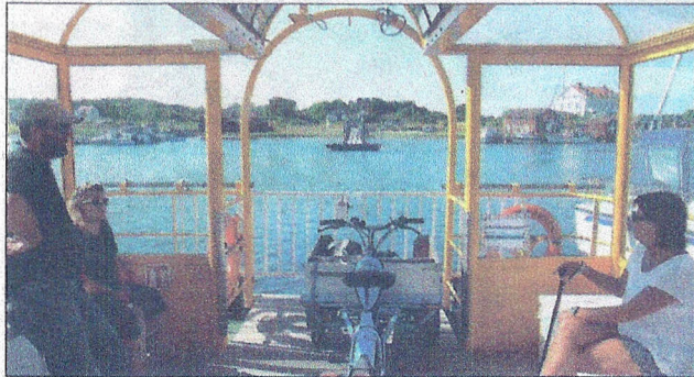
Linfärjan – en smart lösning av transporter mellan Nord- och Sydkoster i det smala sundet.

tiken mitt på Sydkoster, där vägarna går ihop. Här är en bra mötesplats med både kafé och toa. Butiken är öppen året om och visar lite av den