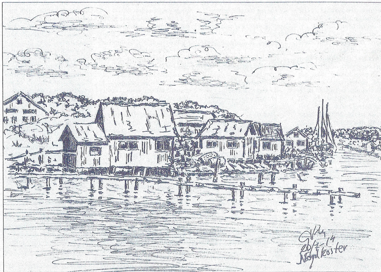
Sjöbodar vid Galejen på Nordkoster, mitt emot Långgårde. Till vänster skimtar ett Äldreboende – troligen med ett av de attraktivaste lägena i landet. Teckning av Göran Värmbly.