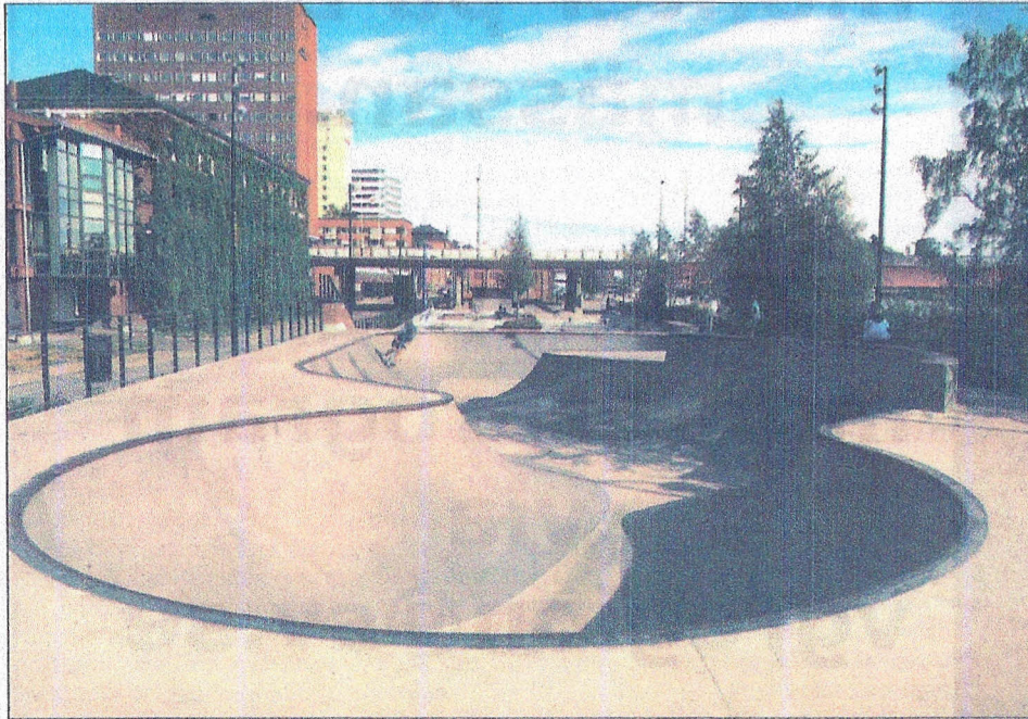
Umeå satsar på lekplatser för barn, mitt i centrum nere vid Umeälven ligger "Sparken", alldeles bredvid Broparken.