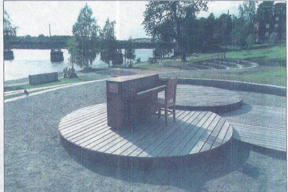
En höjdare i Broparken! Första gången jag ser ett utomhuspiano i en stad. Blev mycket inspirerad, satte mig direkt och rev av Blueberry Hill med tre ackord. I bakgrunden skimtar Umeås första bro byggd 1863, numera omtyckt cykelbro.