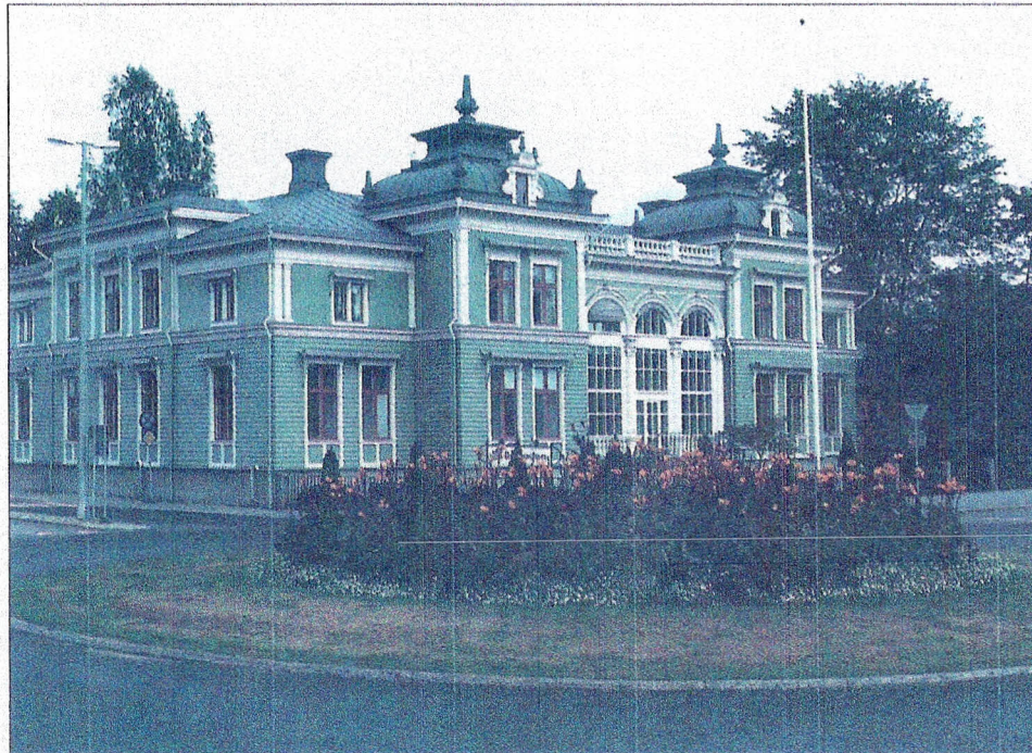
Hus i Jugendstil mitt emot stadskyrkan.