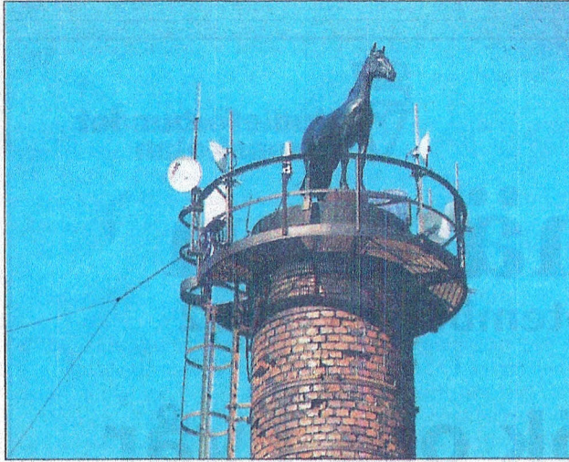
När vi tittar noga ser vi att svansen på hästen svänger i vinden, vilket förhöjer den konst(närl)iga upplevelsen.

Jag blir nästan "knockad" av alla konstverken. De griper tag i en och de är väldigt